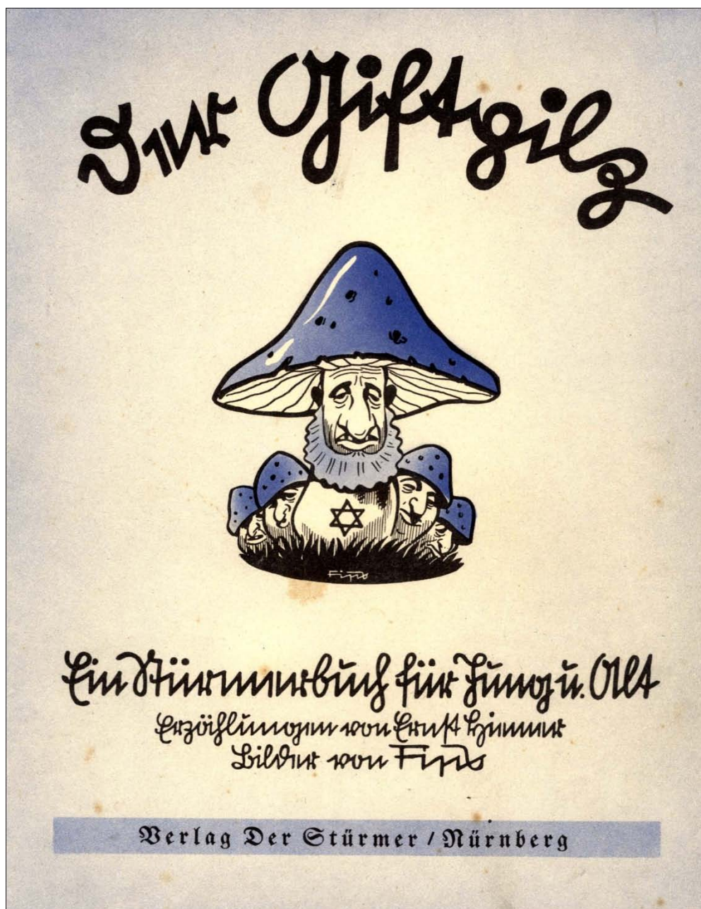
Abb. 1 mit Bildtext: Der Giftpilz. Ein Stürmerbuch für Jung u.[und] Alt. Erzählungen von Ernst Hiemer Bilder von Fips 1