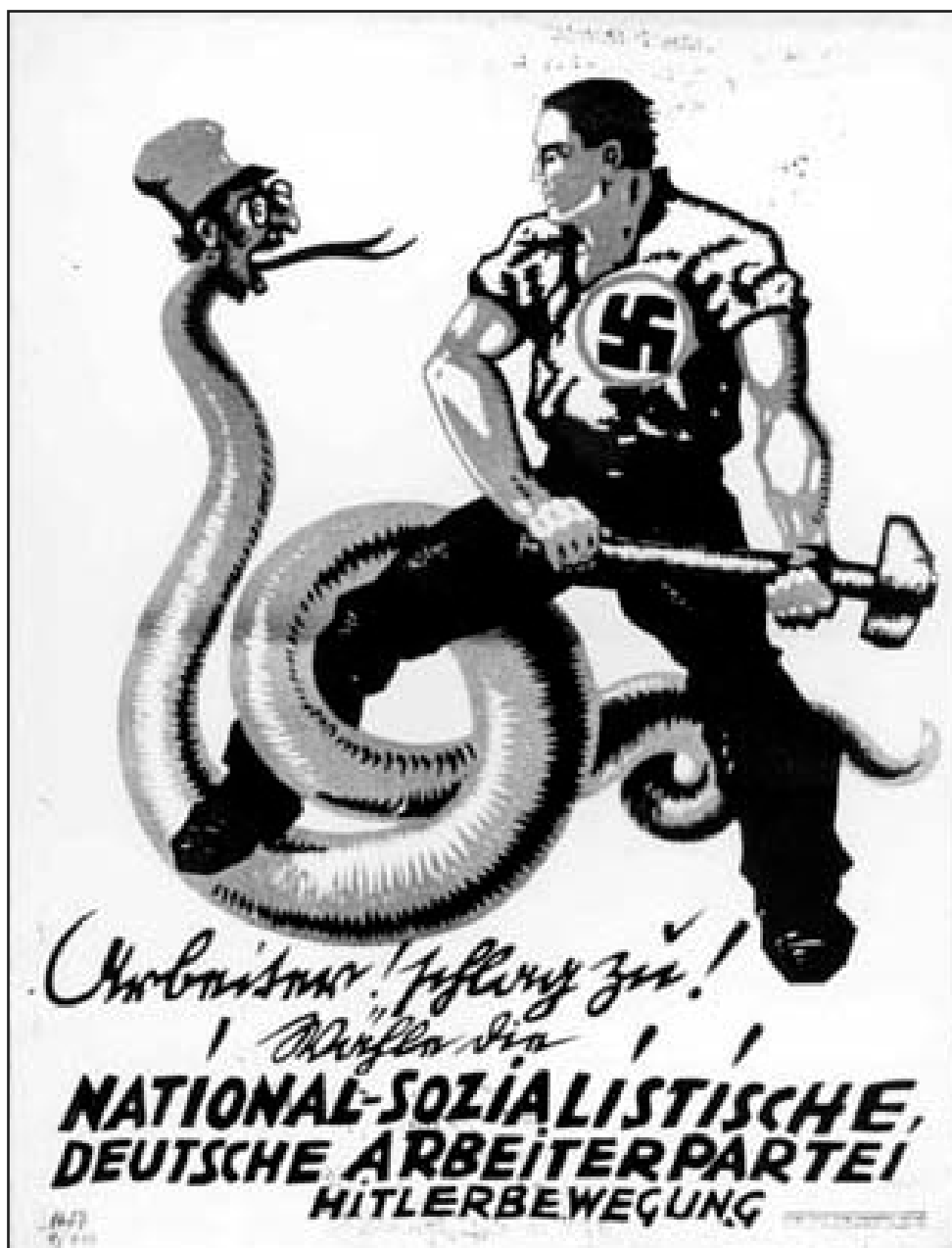
Abb. 4 mit Bildtext: „Arbeiter! Schlag zu! Wähle die Nationalsozialistische Deutsche Arbeiterpartei Hitlerbewegung“