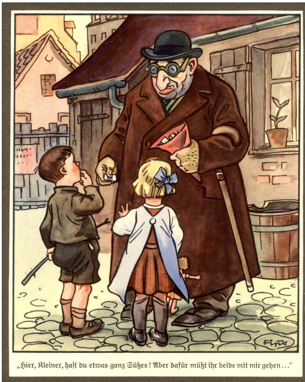
Abb. 3 mit Bildtext: „Hier, Kleiner, hast du etwas ganz Süßes! Aber dafür müßt ihr beide mit mir gehen...“ Abb. 1-3 aus: Archiv Yad Vashem Inv.Nr. 196219, 196221, 196223