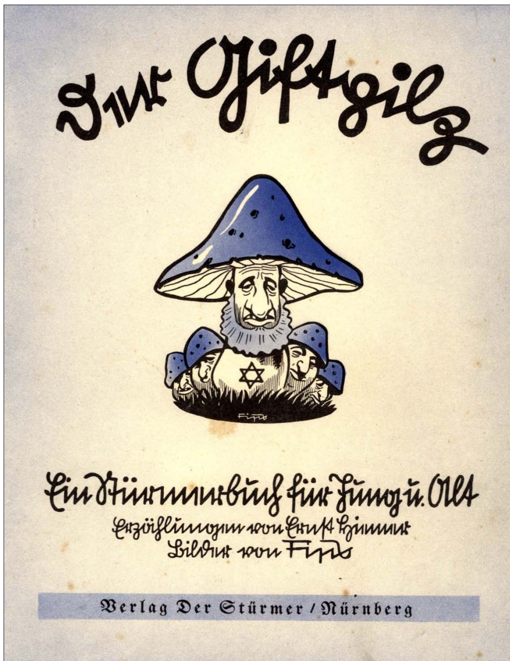
Abb. 1 mit Bildtext: Der Giftpilz. Ein Stürmerbuch für Jung u.[und] Alt. Erzählungen von Ernst Hiemer Bilder von Fips 1