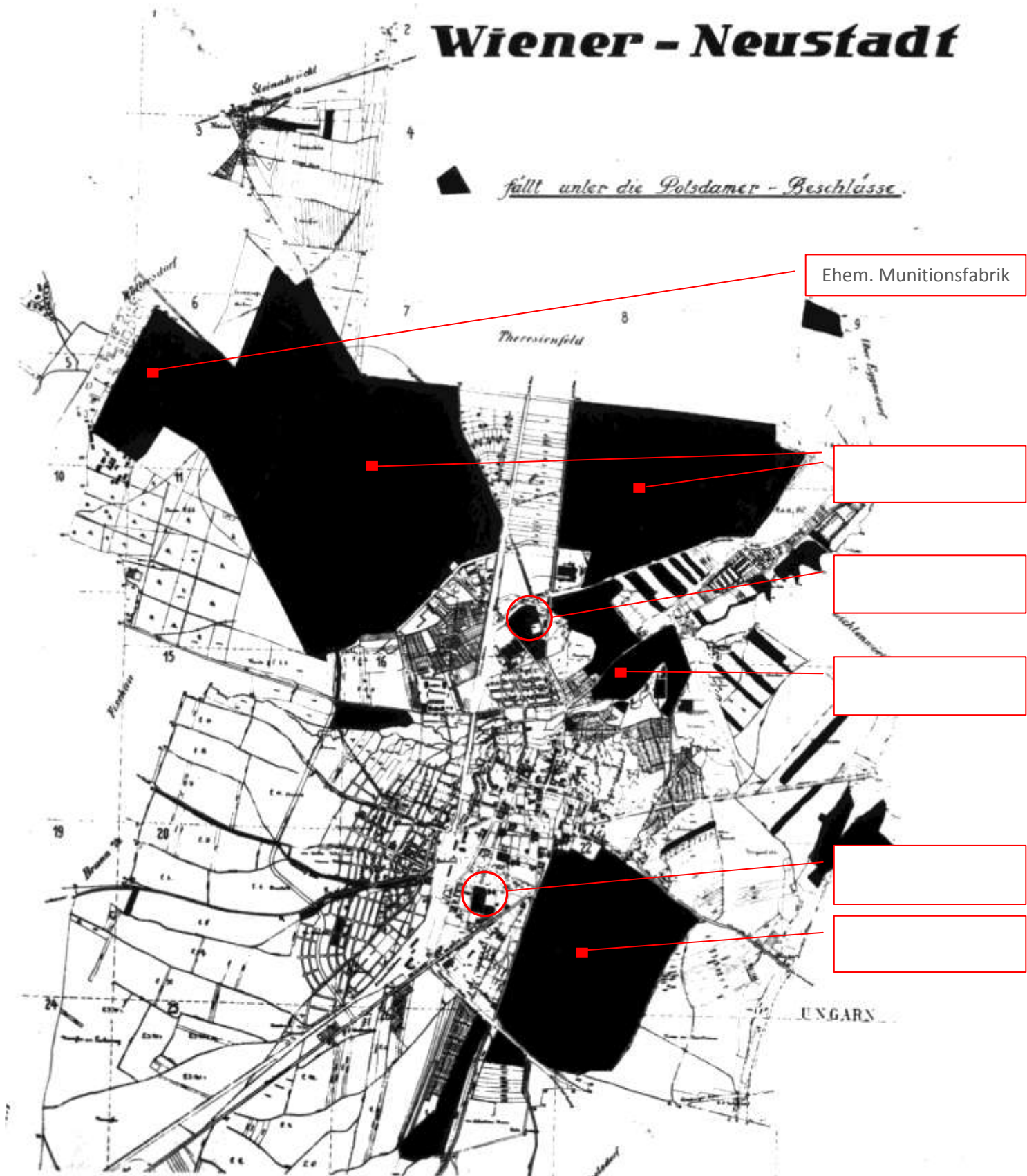
Abb.: Stadtkarte von Wiener Neustadt mit den von den Potsdamer Beschlüssen betroffenen Gebieten aus: Sammlung Sulzgruber